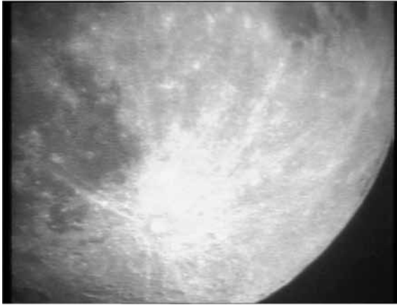
Opname van de maan in AVONTUREN OP HET LAND.