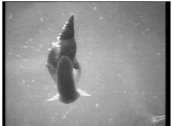
Opname van beestje uit de sloot, in het aquarium in AVONTUREN OP HET LAND.

Het streven naar perfectionisme zit dus eerder in het kunnen vangen van een moment dan in een vlekkeloos afgewerkte eindmontage. Volgens Van der Elskenskenner Jan-Christopher Horak heeft dit gebrek aan perfectionisme te maken met zijn opvattingen over schoonheid. 14 In de jaren zestig heeft Van der Elskens gretig de