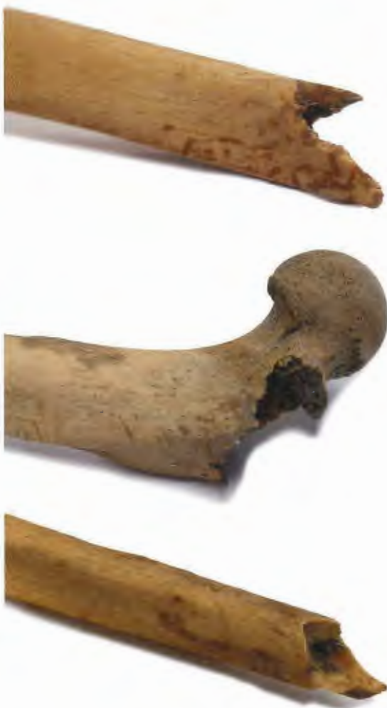
Fig. 4. Voorbeelden van vraatsporen. Boven: de onderzijde van het linker scheenbeen. Midden: de bovenzijde van het linker bovenbeen. Onder: de onderzijde van het linker kuitbeen.

skelet is namelijk opvallend fijngebouwd voor een man en vertoont ook meerdere kenmerken op het bot die vrouwelijk aandoen. Een onderzoek naar het sluiten van de schedelnaden en de ontwikkeling en degradatie van twee articulatievlakken op de heupen (de symfyse op de pubis ofwel schaambeen, en het auriculare oppervlak op het ilium , ofwel darmbeen) wijst uit dat deze vermoedelijke man een leeftijd van 40 \pm 10 jaar heeft bereikt. De lichaamslengte is geschat op ongeveer 1 m. 65 \pm 10 .