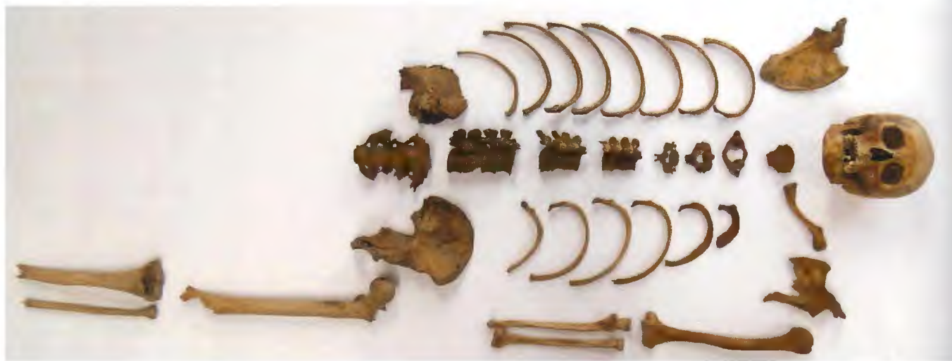
Fig. 3. De verzamelde delen van het skelet van de terp Hizzard.

het terpengebied vaak nogal afwijken van waarden die in het binnenland worden gemeten. In het binnenland is een waarde van 5-8‰ de normale marge, maar de waarden van skeletmateriaal uit het terpengebied liggen aanzienlijk hoger. De \delta^{13}\text{C} waarden zijn echter gelijk aan die van mensen met een binnenlands voedselpatroon. Dat geldt overigens niet alleen voor alleseters zoals mensen, maar ook voor planteneters zoals runderen (Nieuwhof 2015: 241-243). Dat betekent dat de hoge \delta^{15}\text{N} waarden niet worden veroorzaakt door visconsumptie. Waarschijnlijk is een afwijkende stikstofcyclus in het kweldermilieu de oorzaak van de hoge \delta^{15}\text{N} waarden die worden gemeten in de skeletten van kwelderbewoners (Britton et al. 2008). Aan de hand van de afwijkende \delta^{15}\text{N} waarden kunnen mensen die hun hele leven (of in elk geval al vele jaren) hebben gewoond in het terpengebied worden onderscheiden van mensen die uit het binnenland afkomstig zijn.