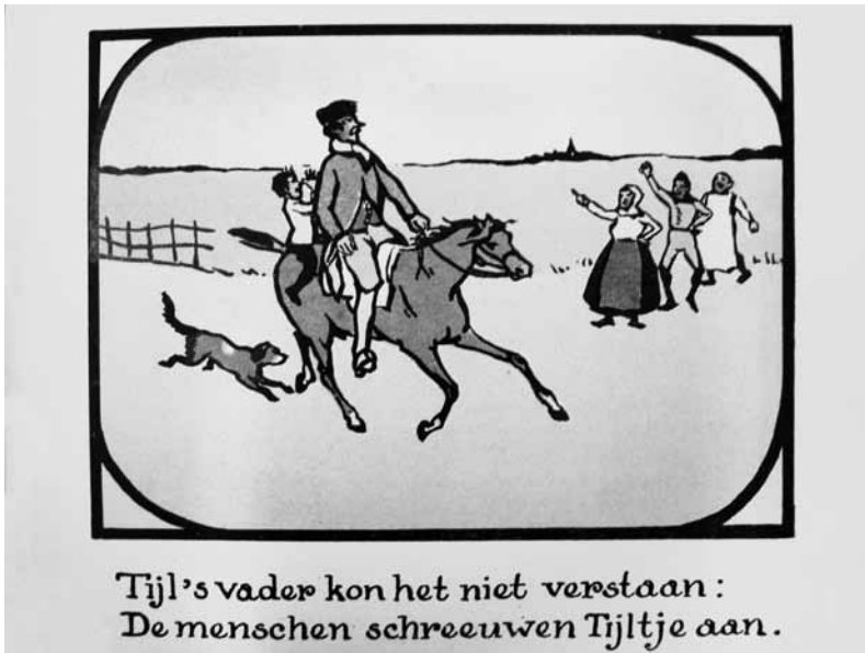
Fig. 4: J. Rinke in Rinke, J. (1909). Tijl Uilenspiegel . Amsterdam, z.p.

lezers te winnen, moeten zij eerst oude lezers zien te overtuigen. Want het zijn die oude lezers die bepalen of de nieuwe Havelaar zal doordringen tot schoolbibliotheken en boekenlijsten. Deze paradox zal ik hier uitwerken met een paar voorbeelden uit bewerkingen van de vier genoemde literaire klassiekers die tussen 1850 en 1950 in het Nederlandse taalgebied zijn verschenen. Ik maak hiervoor gebruik van de resultaten van mijn onderzoek, die zijn opgetekend in mijn proefschrift Meesterwerken met ezelsoren. Bewerkingen van literaire klassiekers voor kinderen 1850-1950 (Parlevliet, 2009).