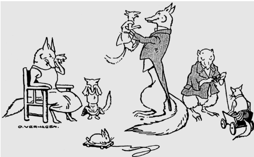
Fig. 6: O. Verhagen in Kuhfus, W. (1931). Reynaert de Vos . Den Haag: G.B. van Goor Zonen's uitgeversmaatschappij, p. 40.

In plaats van een satirische representatie van de middeleeuwse maatschappij, lijkt de illustrator hiermee het idealiseren van de verheerlijking van Reynaerts huisvaderschap op de hak te hebben genomen. De illustratie levert een ironisch commentaar op het vrijpleiten van een moordende, verkrachtende en liegende vos vanwege zijn volmaakte huisvaderschap. Een staaltje van visuele ironie, die niet voor de kind-lezers van de bewerking bedoeld was maar voor de volwassen meelezers.