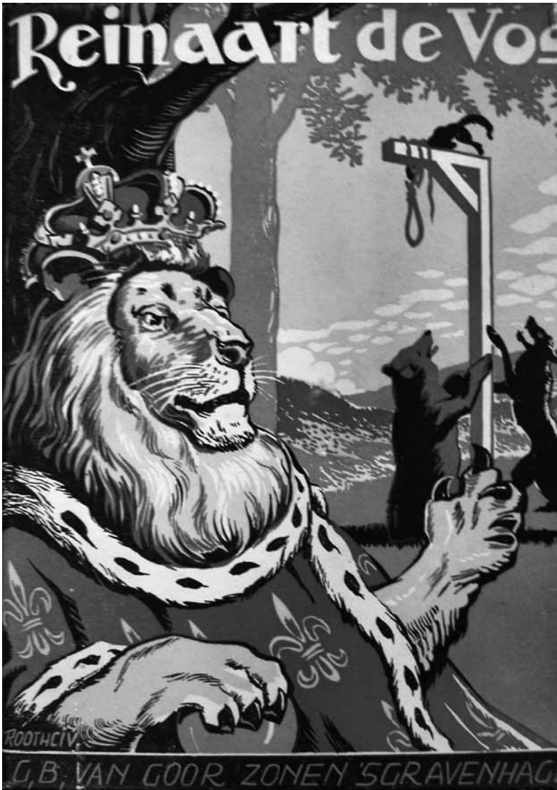
Fig. 1: Zeeuw J. Gzn, P. de (19xx). Reinaart de Vos . 's-Gravenhage: G.B. van Goor Zonen.

klassiek boek zelfs. Zo'n boek waaraan niets veranderd hoeft te worden en waaraan weinig te verbeteren valt.' Het andere kamp legt de nadruk op de nieuwe lezers. In NRC Handelsblad van 12 februari 2010 spreekt Janet Luis van een frisse levendige hertaling met overzichtelijkere en helderdere formuleringen, waarin weliswaar het een en ander geschraapt is, maar, 'aan een