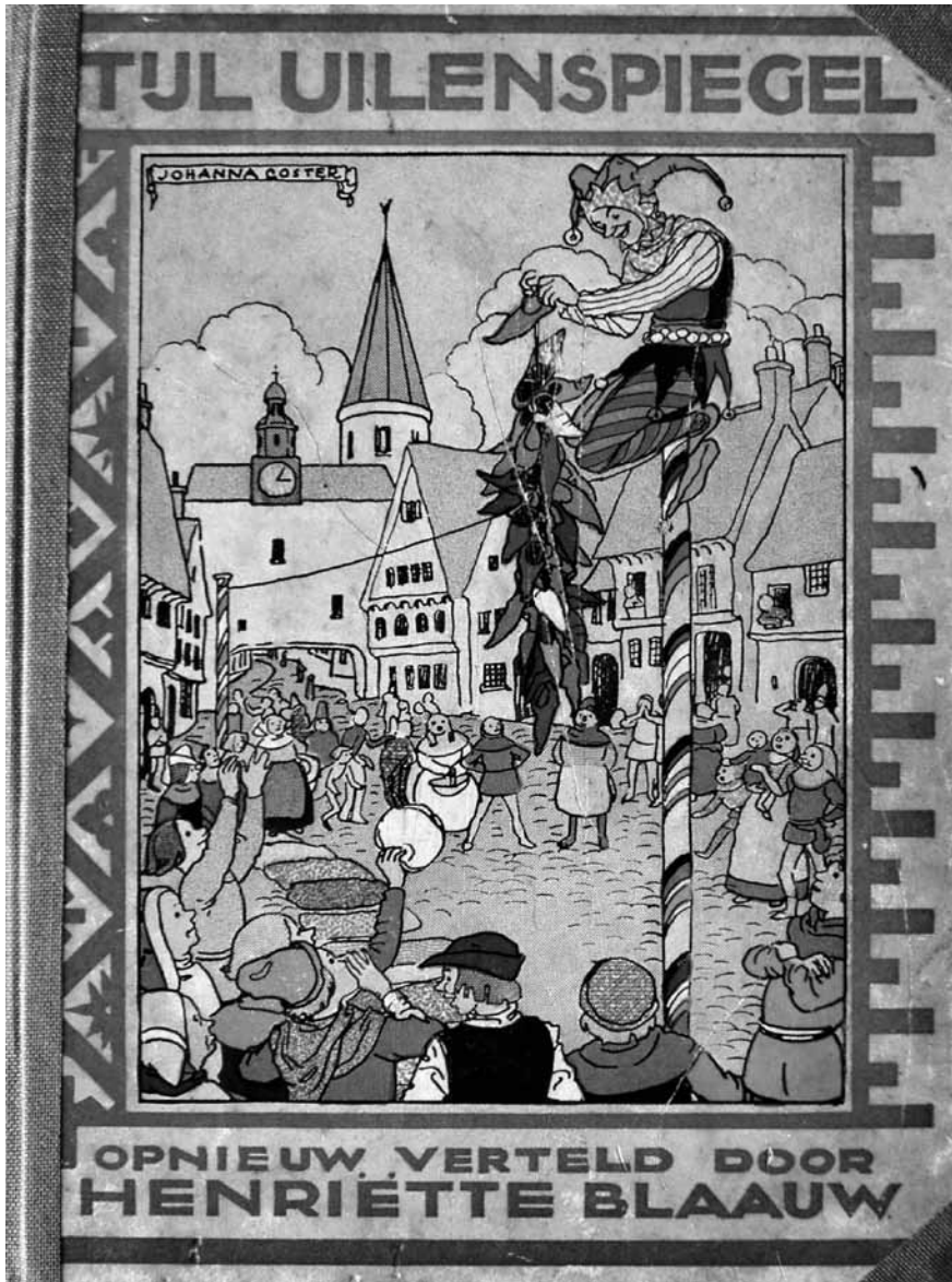
Fig. 2: Blaauw, H. (1918). Tijl Uilenspiegel . Alkmaar: Kluitman.

boom zo vol geladen mist men een, twee pruimpjes niet.’ De nadruk wordt gelegd op de leesbevorderende functie van de hertaling. In een aanbeveling van de nieuwe Havelaar noemt een lerares Nederlands het bovendien ‘een eigentijdse, grappige, spannende en lekker leesbare roman ook voor scholieren’ (Geciteerd naar Luijters, 2010).