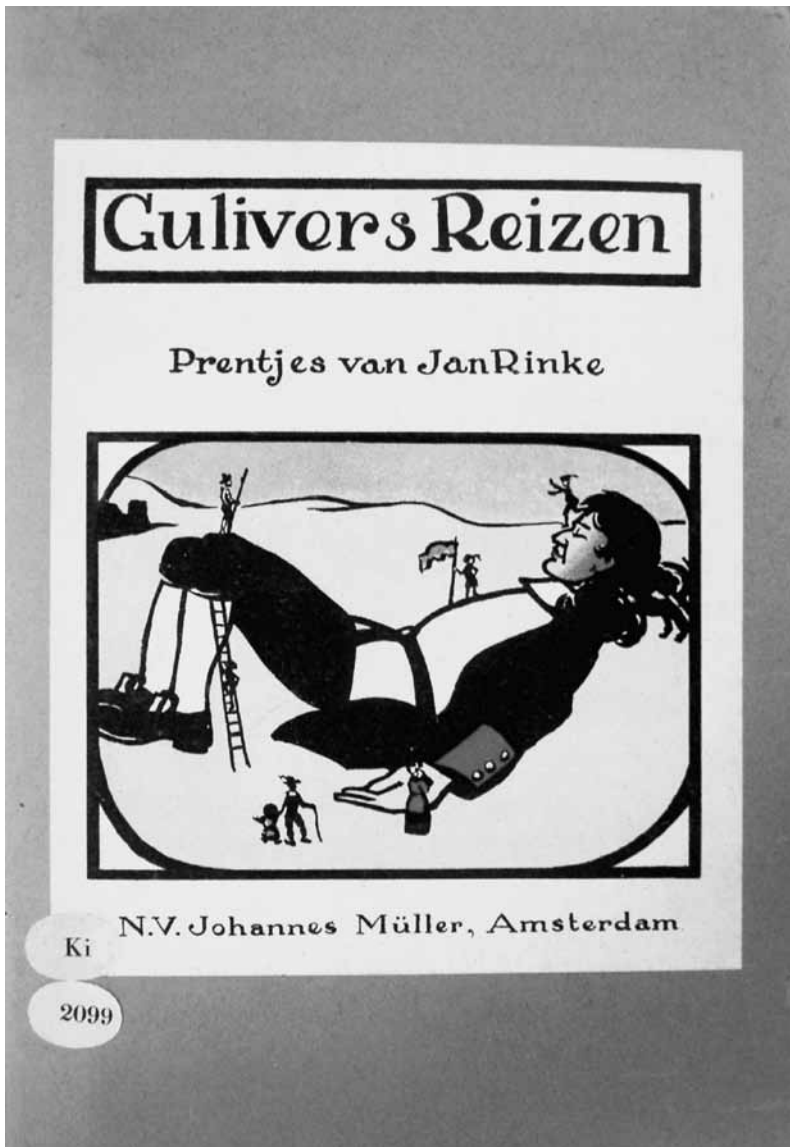
Fig. 5: Rinke, J. (1909). Gulliver's reizen. Amsterdam.

kozen er echter voor Tijls streek niet zomaar weg te laten, maar expliciet te vermelden dat zij iets weglieten wat niet door de pedagogische beugel kon. Zoals Van Zeggelen, die schreef: