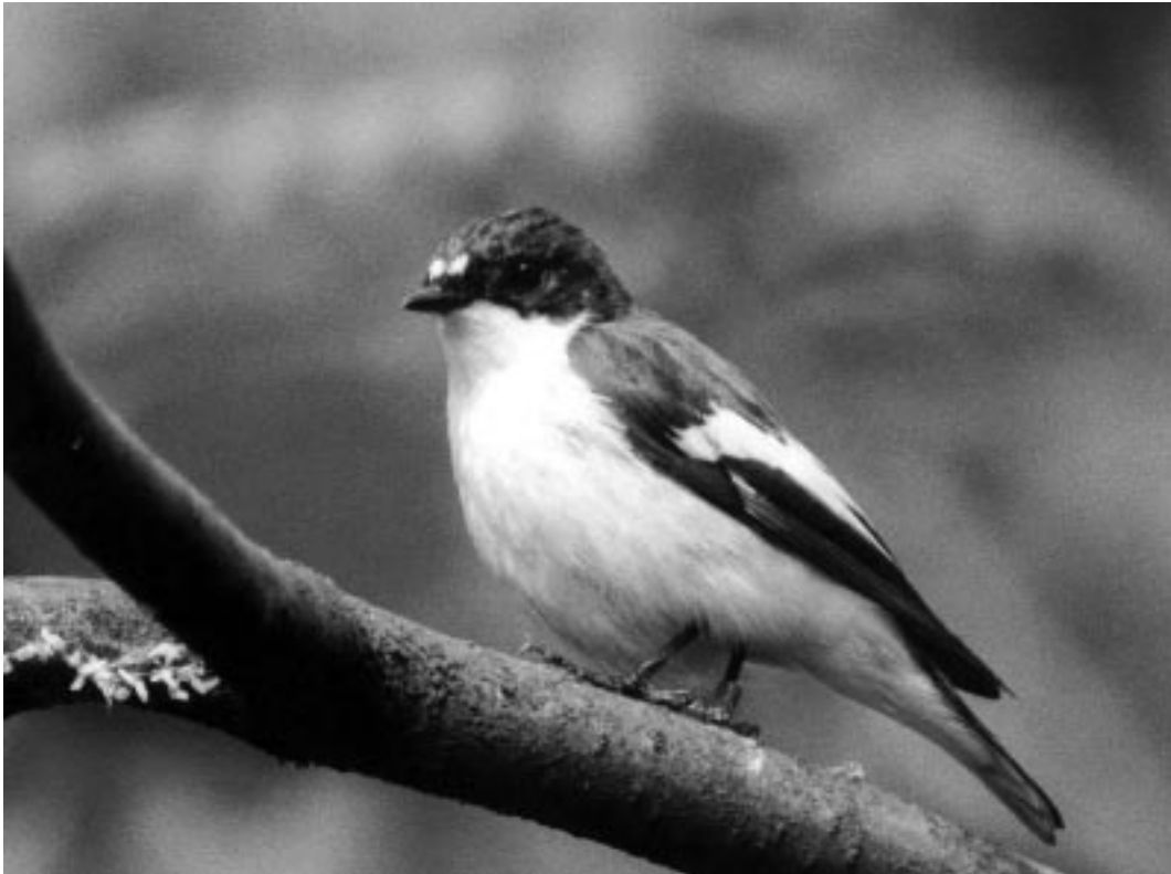
Bonte Vliegenvanger (A.C. Zwaga) European Pied Flycatcher Ficedula hypoleuca .

laatste vier jaar een beperkte afname laat zien (R. Bijlsma). Al deze terreinen liggen in de regio 'Midden' waarvoor Boele et al. lieten zien dat de populatie tussen 1984 en 1999 met ruim 60 procent afnam. Er zijn echter ook nestkastpopulaties die wel zijn afgenomen. In het Liesbos (rijk loofbos nabij Breda) broedden in 1985 nog 13 paar vliegenvangers in de nestkasten, maar in 15 jaar is deze populatie verdwenen. Ook in enkele loofbosterreinen aan de noordwestelijke rand van de Veluwe zijn de aantallen sterk afgenomen in de laatste 15 jaar (o.a. van den Brink 1974).