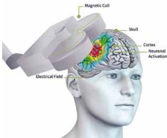
FIGUUR 1 Illustratie van de inductie van elektrische stroom in de hersenen (grijze pijlen in de hersenen) door de magnetische pulsen die worden toegediend door middel van de rTMS-spoel (8-vormige spoel) geplaatst tegen het hoofd. De gestimuleerde locatie bij de meeste rTMS-toepassingen bij depressie is de dorsolaterale prefrontale cortex (DLPFC)

gezonde vrijwilligers, waarbij als bij-effect verbeteringen van de stemming werden gerapporteerd (Bickford e.a. 1987). Na deze eerste observatie hebben de technische vooruitgang en de toenemende beschikbaarheid van TMS-apparatuur geleid tot het verdere onderzoek naar rTMS bij depressie. Momenteel zijn meerdere rTMS-opstellingen goedgekeurd door de Food and Drug Administration (FDA) in de VS voor de behandeling van behandelresistente depressie en sinds kort ook voor de behandelresistente dwangstoornis (OCS).