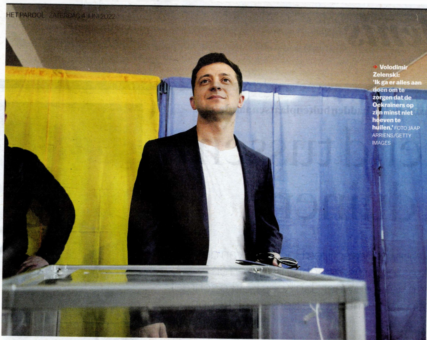
→ Volodimir Zelenski: 'Ik ga er alles aan doen om te zorgen dat de Oekraïners op zijn minst niet hoeven te huilen.'

Zelenski werd in 1978 geboren in een Russisch sprekende Joodse familie in Kryvy Rih, in het