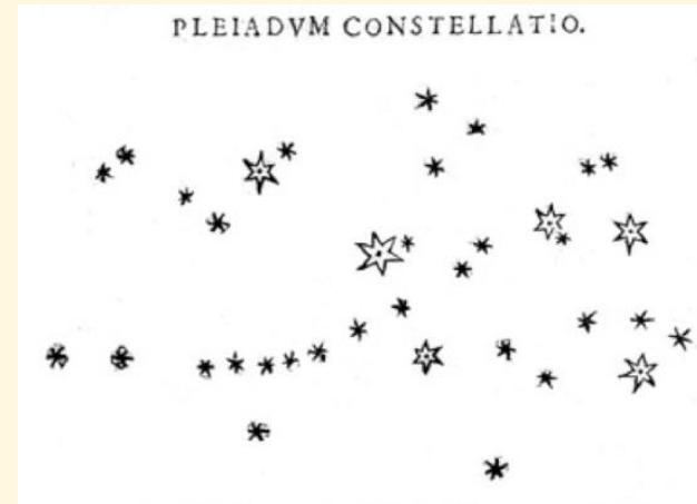
Fig. 1. Diagrammatical pictures from the Sidereus Nuncius (1610). Left: the relative position of the satellites of Jupiter; right: the relative position of the Pleiades.