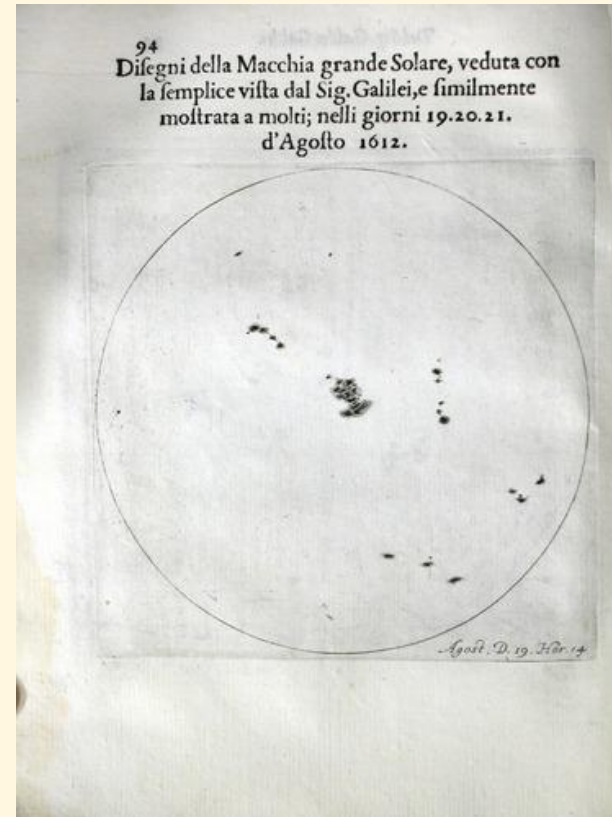
Fig. 2. Realistic pictures. Left : the sunspots ( Lettere Solari , 1613); right: the irregular surface of the moon ( Siderius Nuncius , 1610).