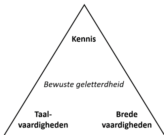
Figuur 1 Integratie in het schoolvak Nederlands

Cruciaal voor de drie onderwijsfuncties zijn bij Nederlands dus het verwerven van kennis over de Nederlandse taal en cultuur , het verwerven van taalvaardigheden en het verwerven van brede vaardigheden . Uiteraard kan de verwerving ervan apart of als een combinatie van een tweetal nagestreefd worden, maar integratie van alle drie biedt meerwaarde. Als het onderwijs alleen gericht is op vergroting van taal- en brede vaardigheden, zonder verbinding met kennis over de Nederlandse taal, literatuur en communicatie, dan verworden die vaardigheden tot lege procedures, zoals het toepassen van ezelsbruggetjes om taalfouten te vermijden, of het impressionistisch reflecteren op leeservaringen.