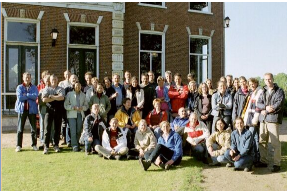
Personnel Lab Pediatrics