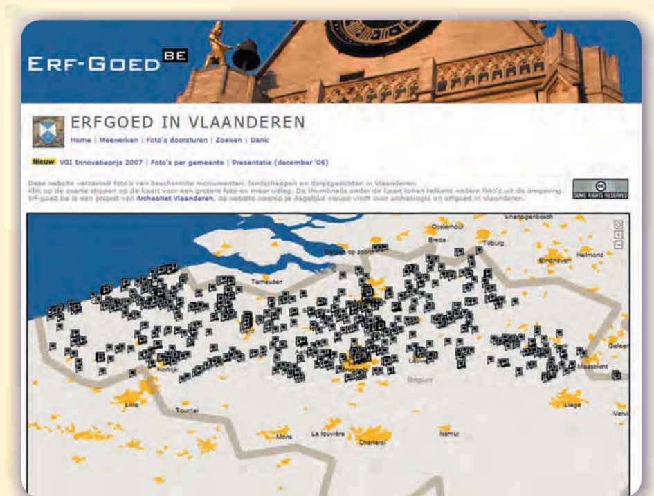
Figuur 3. Op de mashup van Erf-goed.be kan het publiek foto's van beschermde monumenten laten plaatsen onder een Creative Commonslicentie

dat er sprake is van een reproductie van een kunstwerk, dat binnen het project vrij gebruikt kan worden.