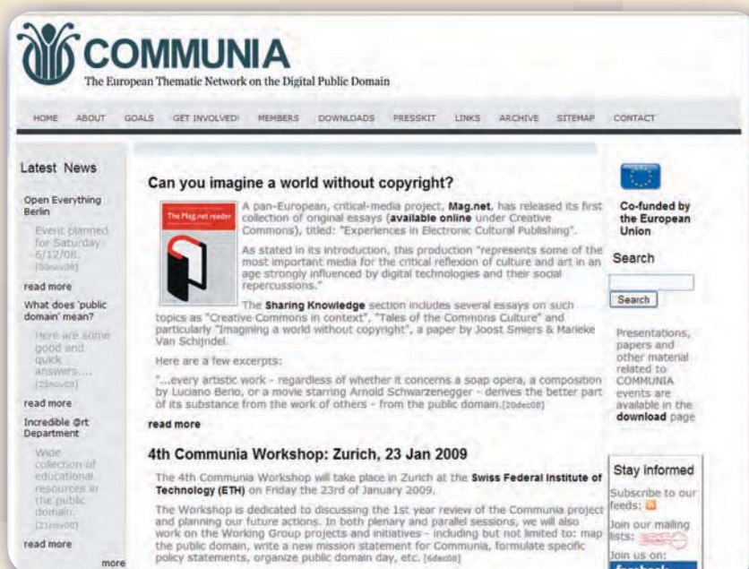
Figuur 2. Het Communia-netwerk verkent juridische, technische en sociale mogelijkheden om het publieke domein op internet te versterken