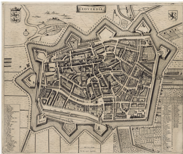
4. Stadsplattegrond van Leeuwarden, met linksboven in een van de bastions de stadhouderlijke tuin en rechtsonder de boomgaarden en siertuinen buiten de singels (gravure, Frederick de Wit, 1644, naar kaarten van Joannes Blaeu en Johannes Janssonius)

De Alkmaarse elite bezat doorgaans een grotere buitenplaats verder weg, bij Heiloo, in de Beemster of de Zijpe. 5 Dat was echter geen wet van Meden en Perzen. Ook rond de singels lagen grotere buitens, zoals Bellevue, de buitenplaats van de zus van Maria Tesselschade, in een rijtje van grotere