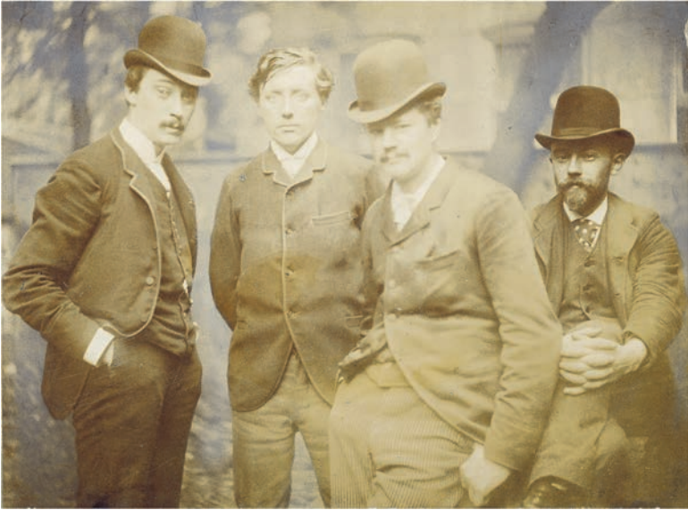
21. De Tachtigers Willem Witsen, Willem Kloos, Hein Boeken en Maurits van der Valk. De buitenplaats en vooral de eigenaar van dit ouderwetse relic werden belachelijk gemaakt in De Nieuwe Gids, tijdschrift van deze literaire beweging