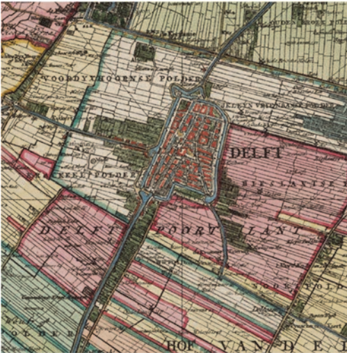
2. Twee fragmenten van een kaart van Delfland. Parallel aan de kust, dichtbij Den Haag (boven), bevinden zich twee lange stroken met buitenplaatsen. Rondom Delft (links) ligt een groene zone met tuinen en (kleine) buitenplaatsen ( gravure, Gebroeders Cruquius, 1712 )

eens dat deze zich onderscheidde door de grote hoeveelheid buitens. 2 Hoe kan, tegen de achtergrond van de alomtegenwoordigheid van de buitenplaats, de betrekkelijke verwaarlozing van dit type erfgoed binnen ons nationale narratief verklaard worden, en wat zijn de gevolgen? Daar wil ik vanmiddag over spreken.