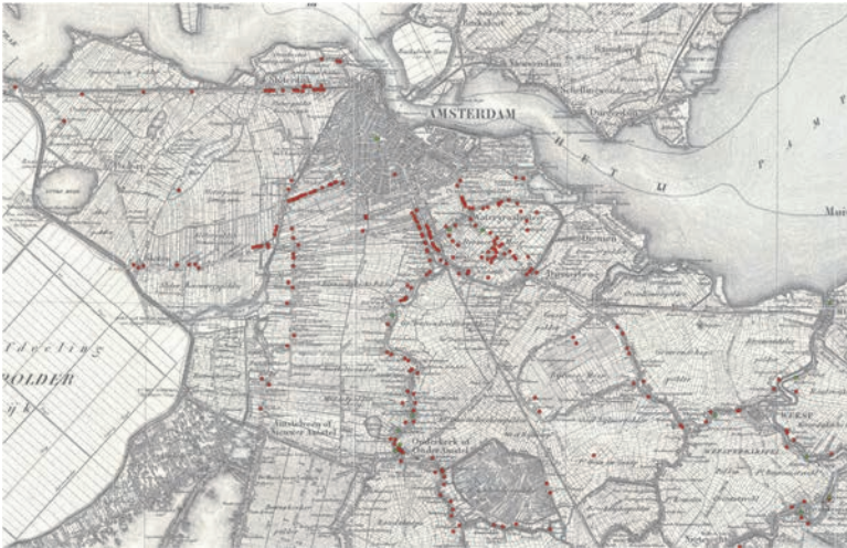
15. Kaart van buitenplaatsen in de omgeving van Amsterdam, vervaardigd door MOOI Noord-Holland. In rood de vele gesloopte en in groen het geringe aantal nog bestaande buitenplaatsen

De buitenplaatsen die nu nog bestaan, mogen we niet beschouwen als een dwarsdoorsnede van wat er ooit was. Ons beeld is zeer fragmentarisch. Eén huis moet soms de herinnering levend houden aan een heel buitenplaatsen-landschap. Verscholen langs wegen en tegen een achtergrond van bedrijven en woonwijken slagen ze daar meestal niet in. Het bijzonder interessante Hofwijck van Constantijn Huygens in Voorburg (afb. 16) ligt er nu verweesd bij, ingeklemd tussen een station, een woonwijk en een weinig idyllisch kanaal met een aangrenzend bedrijventerrein.