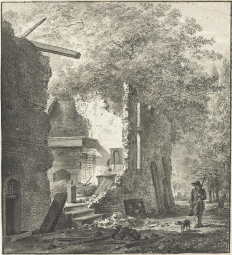
14. Afbraak van het huis Weltevreden bij De Bilt ( tekening, Cornelis van Hardenbergh, eerste kwart negentiende eeuw )