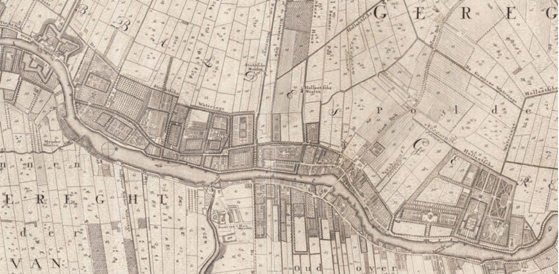
8. Detail van een kaart van Loenen aan de Vecht. Langs de Vecht lag een haast eindeloze reeks buitenplaatsen (gravure, C.C. van Bloemswaerd, circa 1740)

De Amsterdamse trek naar buiten was zonder twijfel spectaculair. Exacte cijfers zijn moeilijk te geven, want het aantal buitens fluctueerde en de definities al evenzeer, maar we mogen uitgaan van een totaal van ongeveer 500 buitenplaatsen in de Beemster, langs de Amstel, het Gein en de Vecht, en in 's-Graveland en Kennemerland. De Engelman Frederic Hervey hield het erop dat de buitenplaatsen rondom Amsterdam simpelweg 'innumerable' waren. 9