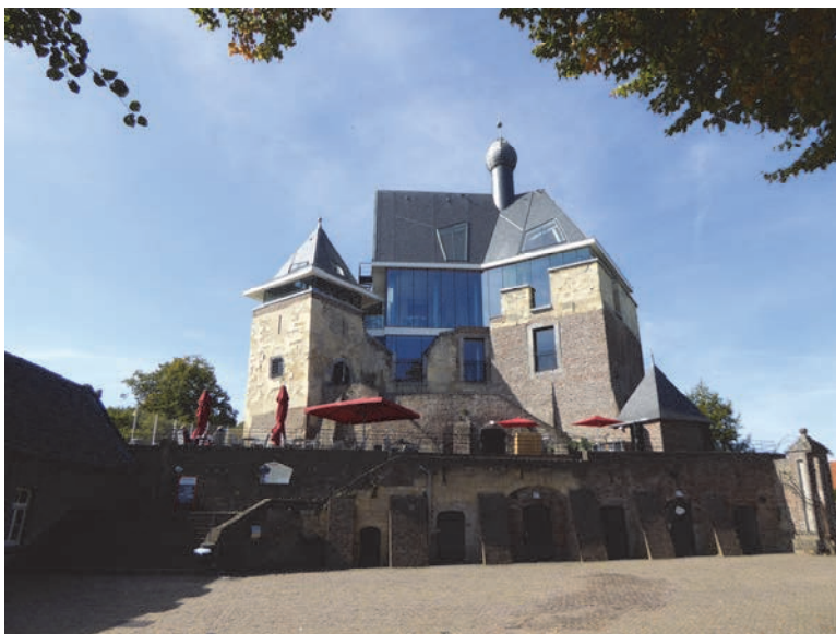
23. Kasteel De Keerbergh te Kessel in Limburg. Het is een gangbare (beleids)opvatting in Nederland dat kastelen en buitenplaatsen herbestemd en ontwikkeld moeten kunnen worden