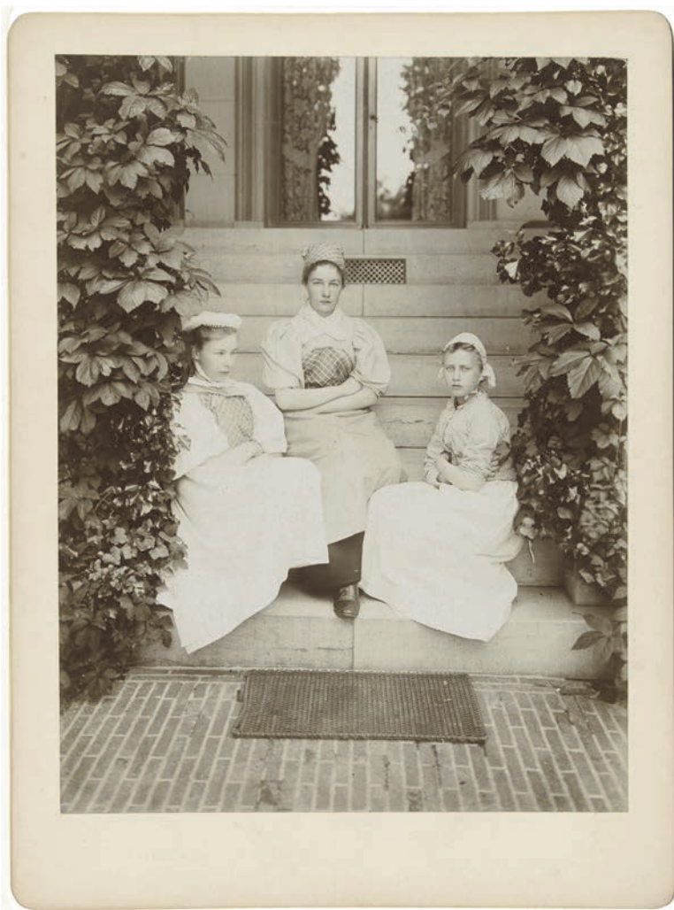
25. Het leven op landgoed Pavia in Zeist. Dienstpersoneel zittend op een trap van de buitenplaats (foto jhr. Henry Pauw van Wioldrecht, augustus 1897)