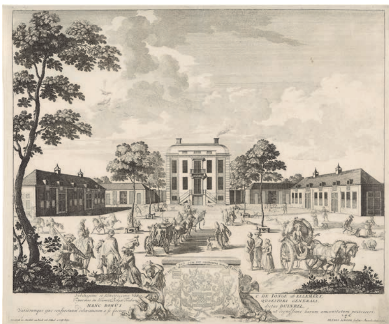
11. Duinrell met koetsen die af en aan rijden, met rechts voor het huis een drietal dat de buitenplaats bewondert. Buitenplaatsen werden drukbezocht als wandellocatie, sociale ontmoetingsplek en proto-museum (ets, Pieter Schenk, 1701)

In deze laatste hut woonde, ontdekte Heimerick Tromp, een echte kluzenaar die, naar het schijnt, na verloop van tijd vervangen werd door een houten pop. Als de deur openging, boog de pop zijn hoofd – met dank aan de boswachter die het mechaniek bediende – en wees met zijn arm op een doods-kist