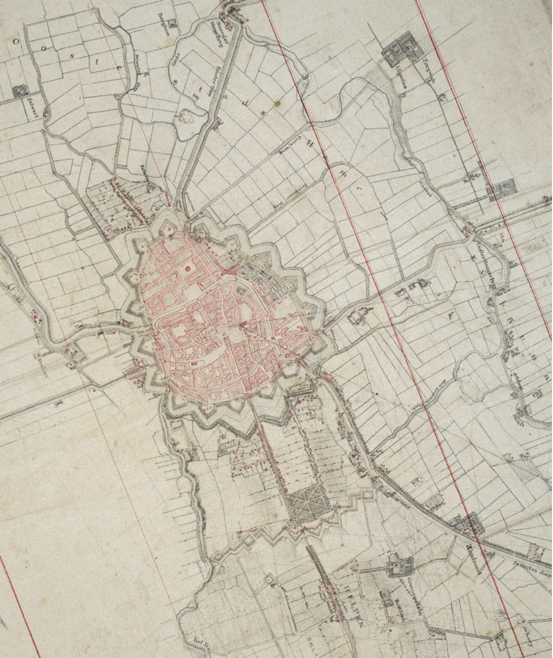
5. Detail van de Hottinger kaart van de stad Groningen en het gebied rondom de stad, 1788-1792, met tuinen net buiten de singels en enkele grotere buitenplaatsen verder weg van de stad