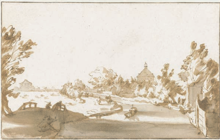
16. Hofwijck aan de Vliet. De landschappelijke context van de buitenplaats van Constantijn Huygens sr. is onherkenbaar veranderd ( pen en penseel in bruin, Jan de Bisschop, 1648-1671 )

De tijd slijt struik en steen. Eens zal men zeggen: 'Hier, hier was 't daar Hofwijck stond, nu puin en kweek en aarde'. 24