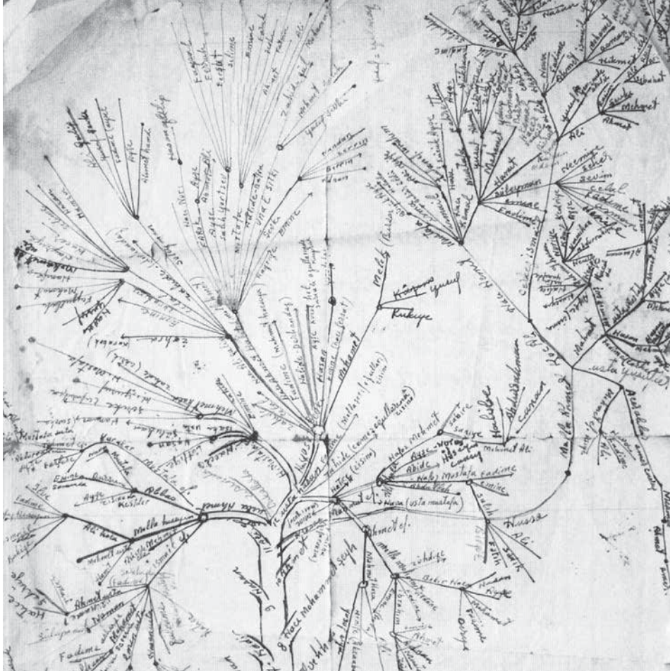
Stamboom uit: Jak den Exter, Sen Kimsin? Voorouders van verre 3 (2008)

sapiens zich vanuit Afrika over de rest van de wereld verspreide. 5